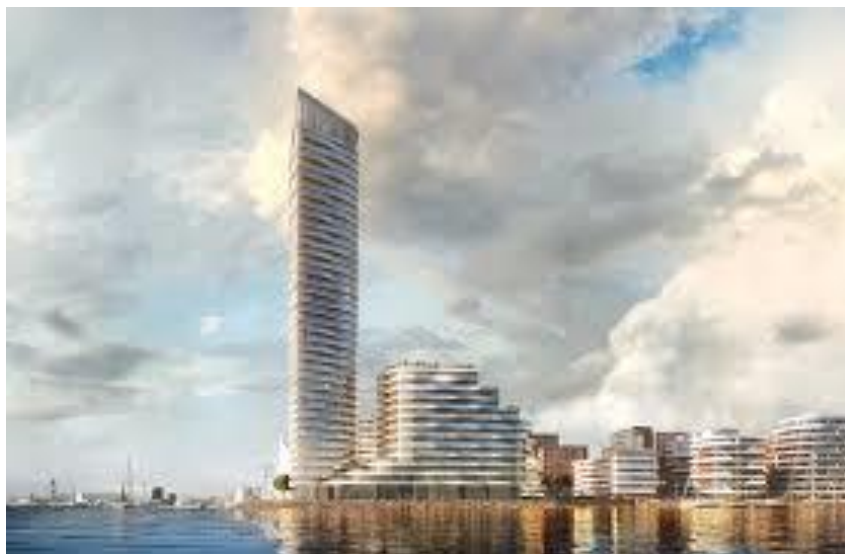
Et projekt med garanteret stort afkast: Udvidelse af Aarhus By ud i bugten med 50 etagers højhuse for velhavere. Med direkte havudsigt. Det fås ikke bedre – og dyrere. Salg af grundene og indtægterne fra beskatning vil være enorme.

- Det vil give svimlende indtægter. Til Havnen og - muligvis - til kommunen.