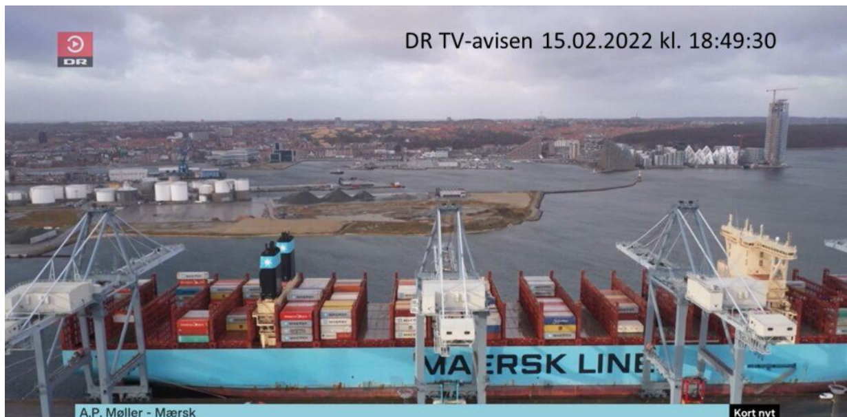
Midi-havne sender mere end hver anden container på lastbil til og fra en Maxi-havn