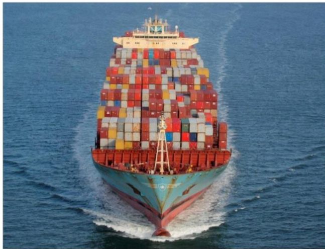
Varetransporten mellem verdens lande foregår i dag ofte med gigantiske containerskibe. Den største containerhavn i Danmark ligger i Aarhus.