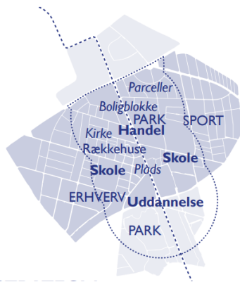
STRATEGI 1 EN GOD BYDEL FOR ALLE