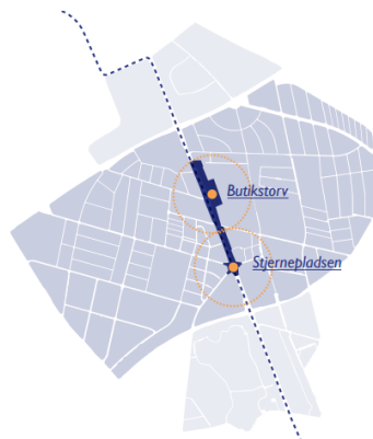
STRATEGI 2 ET STYRKET BYCENTER