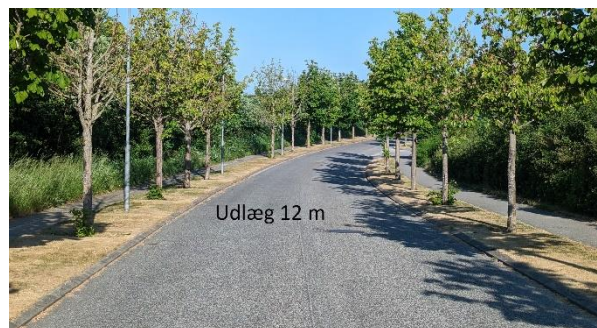
FOTO Hørretløkken set mod vest – standpunkt ved tilslutningen til rundkørslen ved Hørretvej.