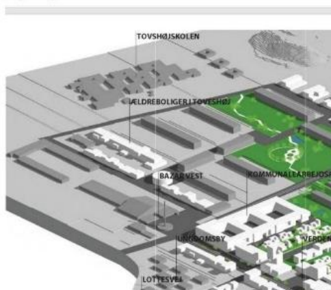
Den 19. november 2010 Aftale om dispositionsplan

I planlægningen af området lægges der stor vægt på, at de kommunale funktioner, der i dag er samlet i Community Centret, kan fungere i tæt sammenhæng, således at synergieffekten mellem bibliotek, socialcenter, lokalcenter, sundhedscenter mv. fastholdes.