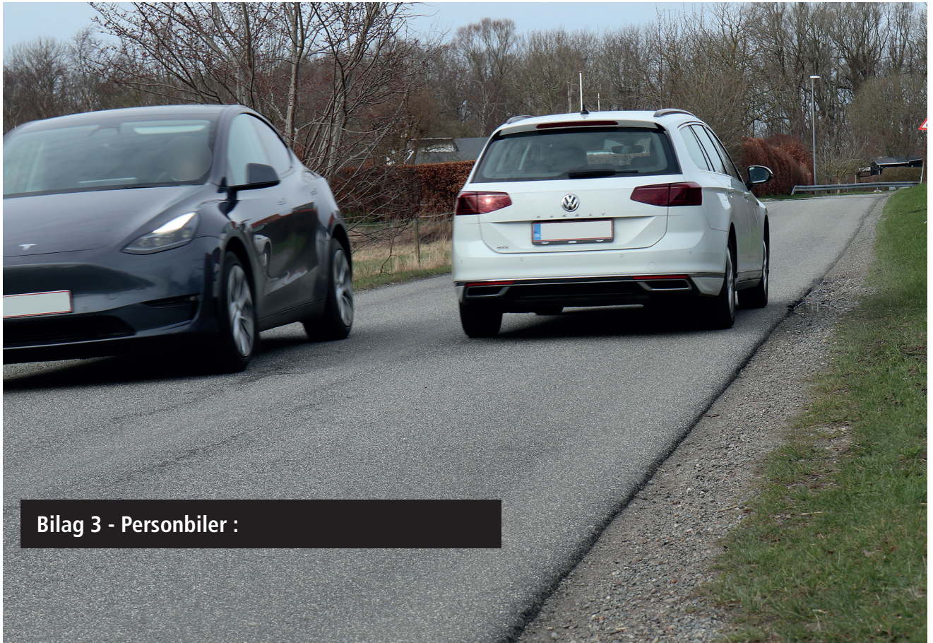
Bilag 3 - Personbiler :