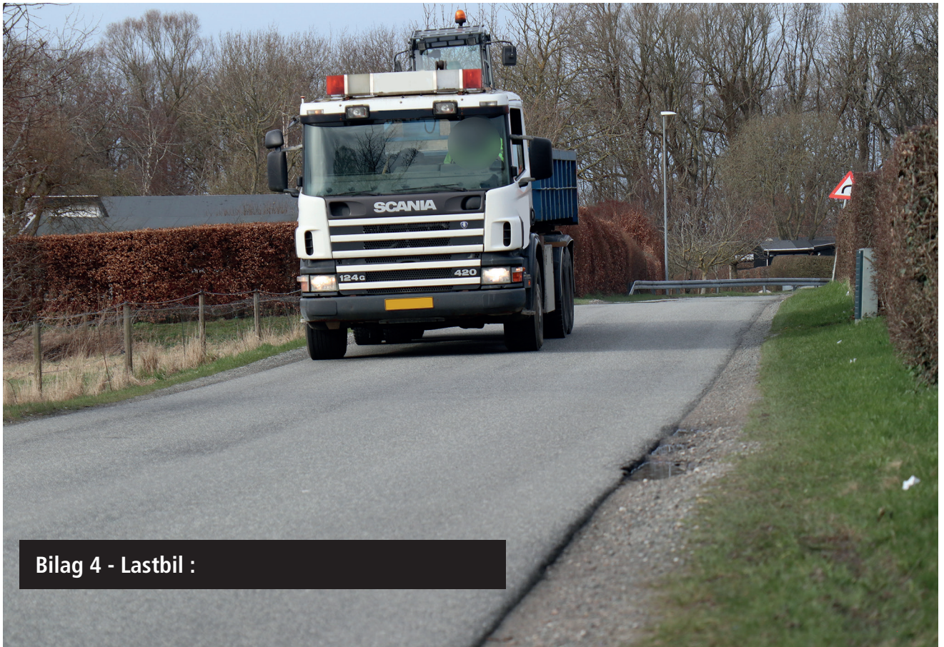
Bilag 4 - Lastbil :