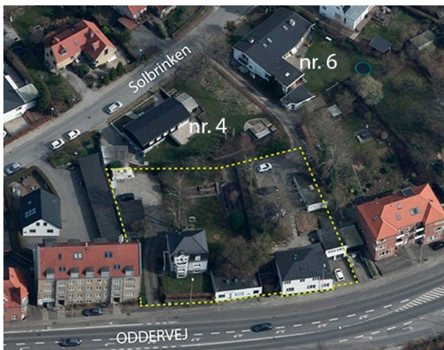
Luftfoto der viser lokalplanens afgrænsning og forhold til naboer på Solbrinken.

Høringssvaret fremsendes som resultat af en positiv dialog mellem bygherre og naboer med ønske om et godt fremtidigt naboskab. Høringssvaret indeholder forslag til ændringer af seniorboligprojektet, som ligger til grund for lokalplanen, og tilhørende konsekvensrettelser i lokalplanen.