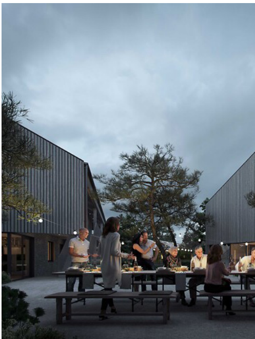
Seniorbofællesskab i naturbydelen