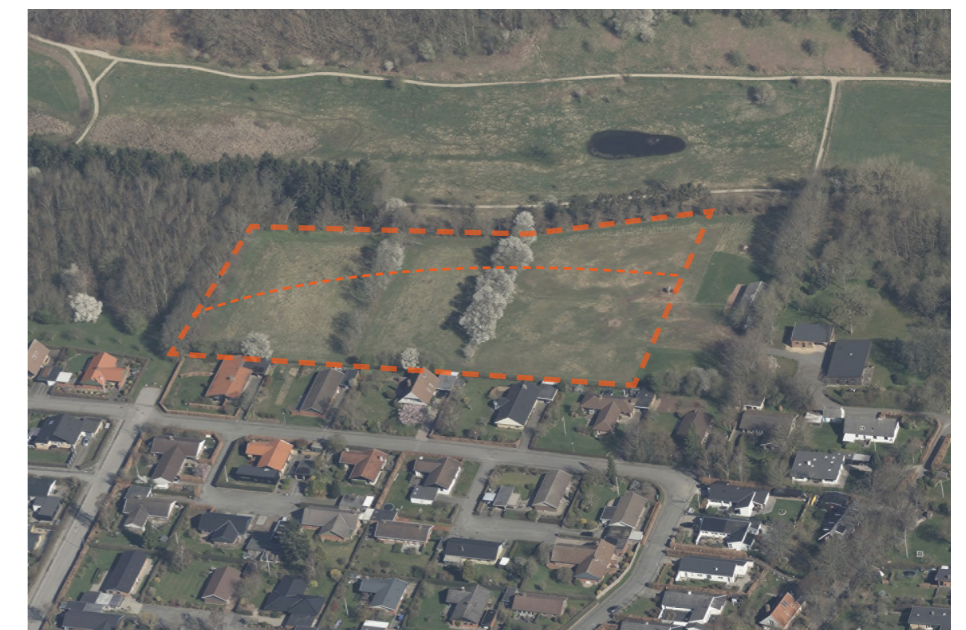
Skråfoto fra 2021