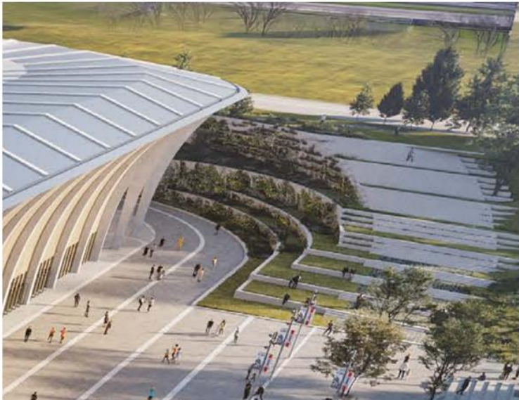
Illustrationseksempel på, hvordan terrænmuren indgår som en landskabelig bearbejdning af flugtvejen til Jydsk Væddeløbsbane. I daglig drift vil der ikke være adgang til væddeløbsbanen, da væddeløbsbanen er indhegnet.

Der bør tilføjes følgende til lokalplanens bestemmelser: